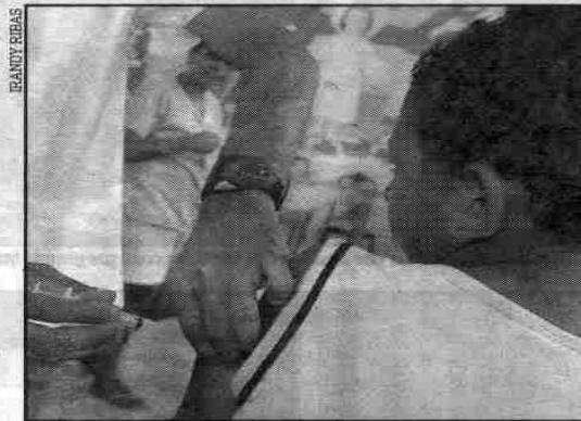
Os agentes de saúde imunizaram crianças e adultos até 25 anos

Lopez garantiu que todos que necessitavam foram imunizados: crianças e adultos entre dois meses e 25 anos, dentro do chamado "quadrilátero epidemiológico". "Todas as casas da Chaparral foram atendidas, batemos de porta em porta", afirmou. "Houve concentração neste bairro, devido aos casos acima da média mundial de doença meningocócica".