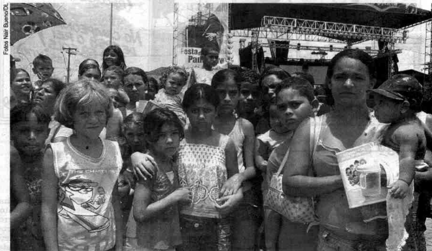
Mães que foram até a Praça 14 Bis por causa de boato sobre campanha de vacinação ficaram revoltadas

Preocupados com o surto da doença na Cidade, o grupo de mães que estava na Praça 14 Bis, realizou uma manifestação em frente ao Hospital de Vicente de Carvalho, na inauguração