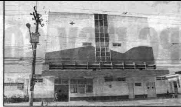
Duas salas do PS de Vicente de Carvalho serão entregues