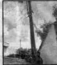
Iluminação é ruim

Ele cobra melhorias. "Aqui em Guarujá todo morador, além de arcar com IPTU, tem de bancar também a taxa de iluminação pública. Tudo isso